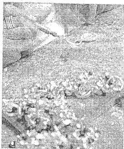
Preziosi in lavorazione

RIMINI - Se c'è un trend che connoterà la moda estiva in maniera incisiva e originale, questo è l'uso che gli stilisti hanno fatto delle gemme intrecciandole indissolubilmente con abiti e accessori, riciclandoli. Un connubio, quello tra moda e gioielleria, che non è certo dell'ultima ora. Ciò che cambia rispetto al passato è in fondo il 'ruolo' che giocano i gioielli. Ovvero non più solo ed esclusivamente esornativo, decorativo e finalizzato a impreziosire l'abito. Ora le gemme sono parte integrante. Danno forma luce e calore alla moda. E questo non deve stupire perché i fashion designer ci hanno abituati ormai a una commistione di stili a 360 gradi, dove si fa labile la distinzione tra materia e forma. Anzi dove una si sostanzia nell'altra. Innanzitutto, l'estate alle porte offre un vero e proprio trionfo del colore. Rubini, ma anche tormaline, quarzi, giallo citrino, rosa ametista. Gemme che tornano in voga insieme all'oro rosa, ma anche tagli e forme più moderne richiedono contrasti netti di